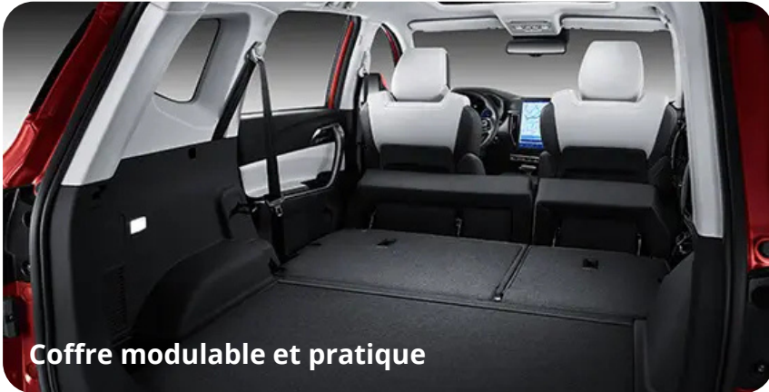
Coffre modulable et pratique