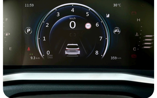
Affichage clair moderne